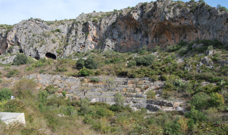
PLA DE PETRACOS